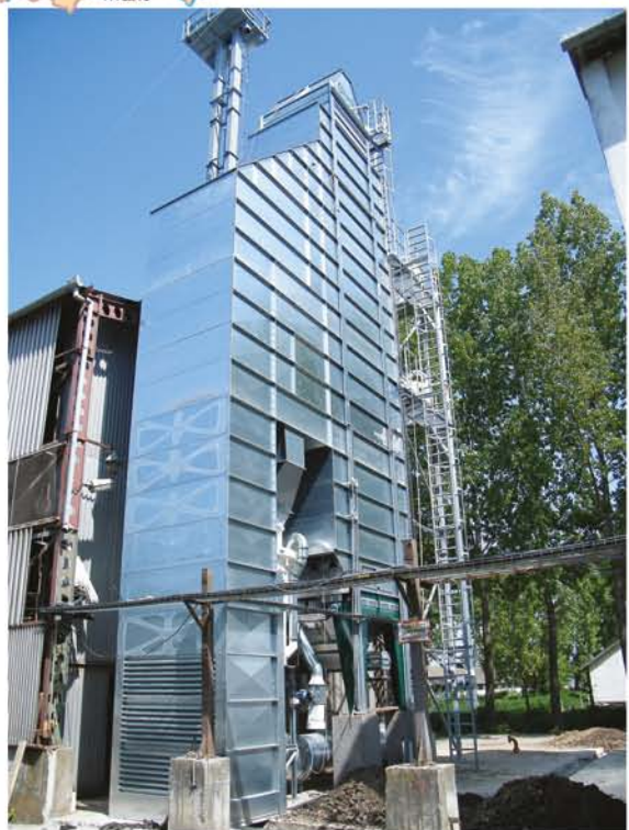
Kardos Cimbria tisztító és szárítófolyamat technológiai szerelése, üzemvezérlés kivitelezése