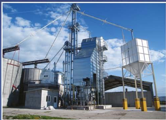
gyártás, gépészeti szerelés