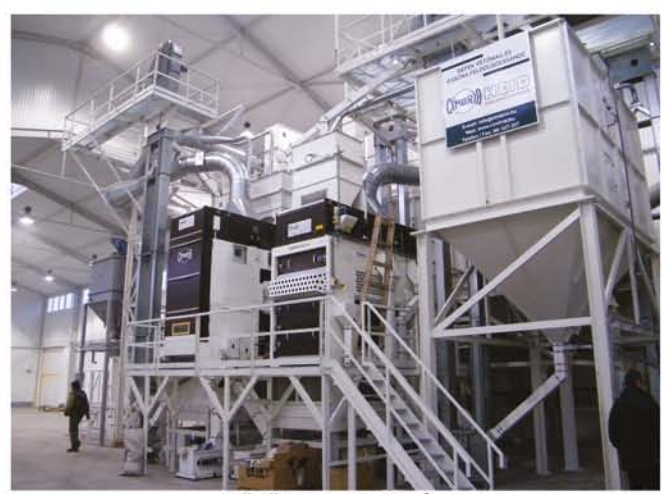
Törökszentmiklós Cimbria vetőmagüzem technológiai szerelése, villanszerelési munkái