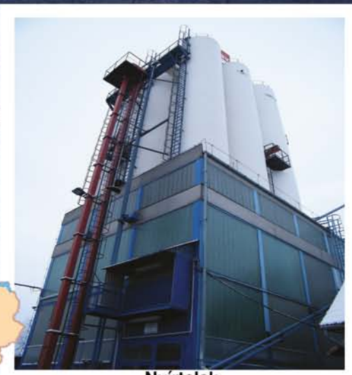
Nyirtelek Takarmánykeverő üzem korszerűsítési, átépítési munkái, MAG Kft. komplett premix-gyártó üzemrész technológiai szerelése