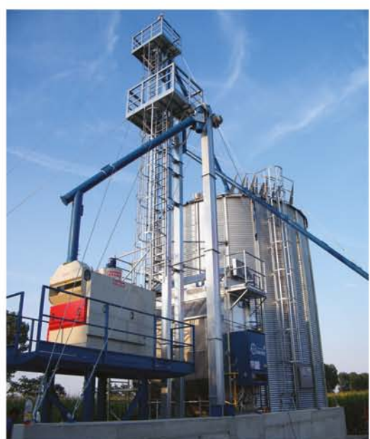
Kondoros Áber szárító és tisztítófolyamat technológiai szerelése